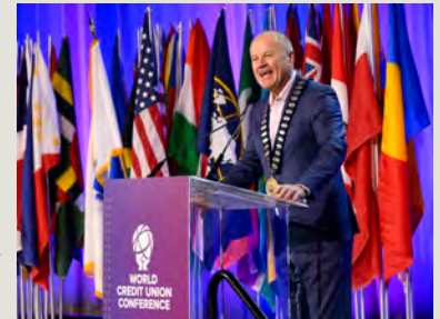
Michael Lawrence (Australia) da su primer discurso como presidente del Consejo de WOCCU en la Conferencia Mundial de Cooperativas de Ahorro y Crédito 2024.