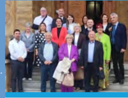
Skopje, Macedonia del Norte Reunión de la Red Europea de Cooperativas de Ahorro Crédito (ENCUC) con FULM Savings House.