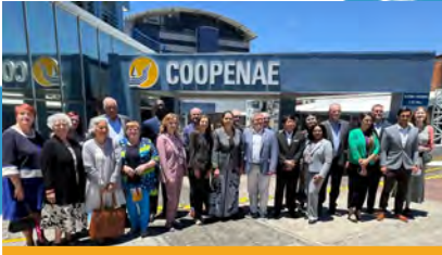
San José, Costa Rica Reunión del Consejo de Directores de WOCCU, organizada por la Federación de Cooperativas de Ahorro y Crédito de Costa Rica (FEDEAC).

Los ejecutivos de WOCCU y de la Fundación Mundial interactuaron con ustedes y sus cooperativas en eventos realizados en cinco continentes durante 2024, incluyendo: