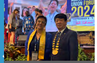
Bali, Indonesia Conferencia Anual de la Confederación Asiática de Cooperativas de Ahorro y Crédito (ACCUC).