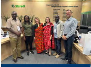
Curitiba, Brasil Intercambio Internacional entre ACCOSCA (África) y Sicredi (Brasil).