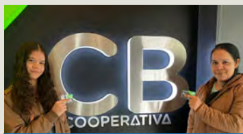
Estas mujeres usaron sus identificaciones venezolanas para abrir cuentas y recibir tarjetas de débito en CB Cooperativa en Cuenca, Ecuador.

Gracias a los esfuerzos de defensa de WOCCU, los refugiados y migrantes venezolanos que viven en Ecuador ahora tienen una mayor capacidad para alcanzar sus objetivos financieros. Se lograron cambios en la Normativa de Cuentas Básicas del país, lo que permite a estas personas abrir cuentas en cooperativas y recibir tarjetas de débito utilizando únicamente su identificación venezolana.