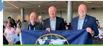
Sidney, Australia Conferencia Ignite the Future 2024 de la Asociación de Banca Propiedad de Clientes (COBA).