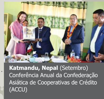
Katmandu, Nepal (Setembro) Conferência Anual da Confederação Asiática de Cooperativas de Crédito (ACCU)