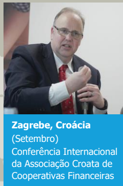
Zagreb, Croácia (Setembro) Conferência Internacional da Associação Croata de Cooperativas Financeiras