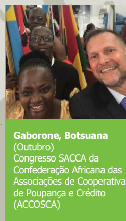
Gaborone, Botsuana (Outubro) Congresso SACCA da Confederação Africana das Associações de Cooperativas de Poupança e Crédito (ACCOSCA)