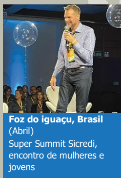
Foz do Iguazu, Brasil (Abril) Super Summit Sicredi, encontro de mulheres e jovens