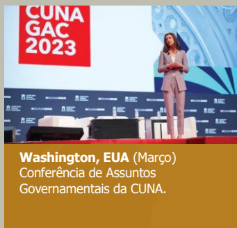
Washington, EUA (Março) Conferência de Assuntos Governamentais da CUNA.

Os executivos do WOCCU interagiram com nossos membros e suas cooperativas afiliadas em eventos nos cinco continentes em 2023: